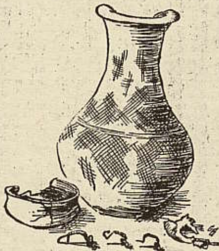
Skelettgrab aus der Mittel-Latènezeit (3. Jahrhundert v. Chr.) Tonflasche, Schüssel, 3 Broncefibel, 1 Eisenfibel (Reste)