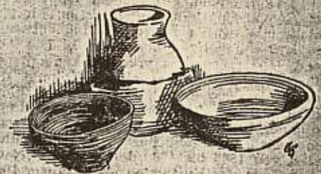
Brandgrab aus der Spät-Latinezzeit (100 v. Chr.) Tonflasche, eine größere und eine kleine Schüssel